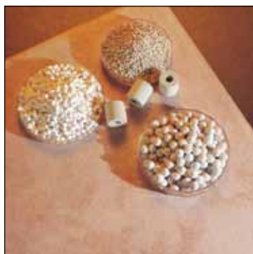
Catalíticos y cerámicas