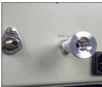
Puertos de Gas y de Vacío