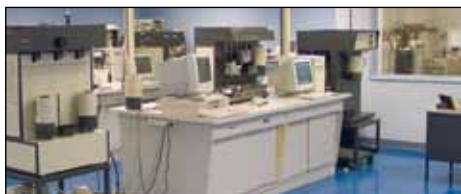
Laboratorio de Caracterización de Quantachrome Instruments

Estas propiedades son esenciales para la selección de materiales utilizados en baterías, celdas de combustible, catalizadores heterogéneos, productos farmacéuticos, cerámicas, carbones, zeolitas, materiales meso y micro porosos avanzados, pigmentos, productos alimenticios, y realmente cualquier producto sólido que tenga que interactuar con algo a través de su superficie. Quantachrome ofrece una gran variedad de instrumentos automatizados para análisis con gases, vapores, y agua, picnómetros de desplazamiento de gas, analizadores de flujo para quimisorción, y porosímetros para experimentos de intrusión de Mercurio utilizados para investigación y para control de calidad a nivel industrial.