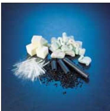
Espumas y Fibras

Posee una interface para comunicarse con una balanza analítica para transferencia automática del peso de la muestra, eliminando el riesgo de transcribir el valor incorrectamente.