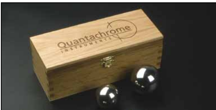
Esferas de calibración de NIST